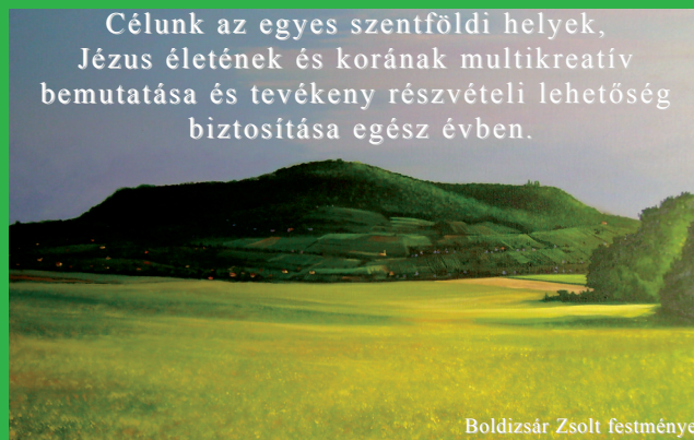
Boldizsár Zsolt festménye

Célunk az egyes szentföldi helyek, Jézus életének és korának multikreatív bemutatása és tevékeny részvételi lehetőség biztosítása egész évben.